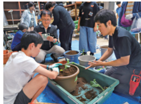
野菜苗の植え付け (2024年)

す。自分で植え付けしたプランターは持ち帰り、自宅で栽培できることも魅力の一つです。他にも、種苗会社による「種」についての講座や、ポッカサッポロフード&ビバレッジ株式会社と共同で開いたレモン講座なども人気です。知識を身に付けながら体験することもできます!