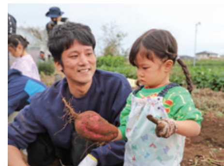
大きなサツマイモを収穫