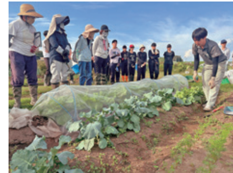
職員のアドバイスのもと、栽培実習

座学による知識習得のほか、磐田市の「いわたファミリー農園」で秋冬野菜のキャベツやジャガイモなど8品目を実際に栽培します。うね立てから始まり、種まきや追肥、間引き、除草といった圃場管理などをJA職員の丁寧なアドバイスのも