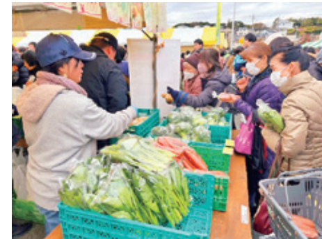
「いわた農業まつり」での販売体験

と学びます。個人ではなかなか経験できない、ご自身の農地の土壌診断、FM・直売所の見学なども体験できます。