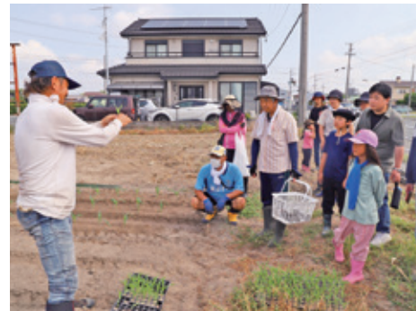
トウモロコシ定植体験