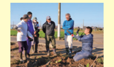
海老芋新規担い手栽培講習会