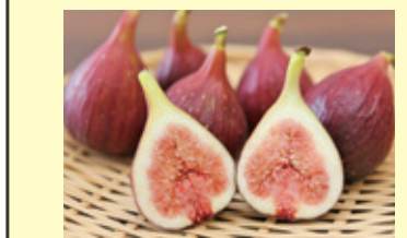
いちじくウェルカム講座

退職後や、農業に従事したい若者など、新たな夢を追いかけてみたい方向けた各種講習会をご案内しています。皆さまのご参加をお待ちしています!