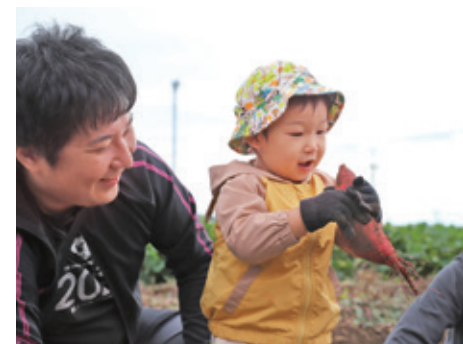
親子で参加してくれました

参加費無料で子どもと一緒に農業体験ができる貴重なイベント。収穫したサツマイモと、地元菓子店の「サツマイモロールケーキ」をお土産として持ち帰ることができるのもうれしいポイントです。