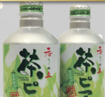
茶ピア ミニボトル缶 1箱(290g×24本)