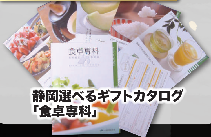
静岡選べるギフトカタログ 「食卓専科」