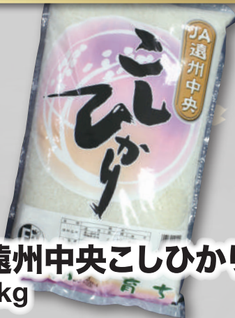
遠州中央こしひかり 5kg