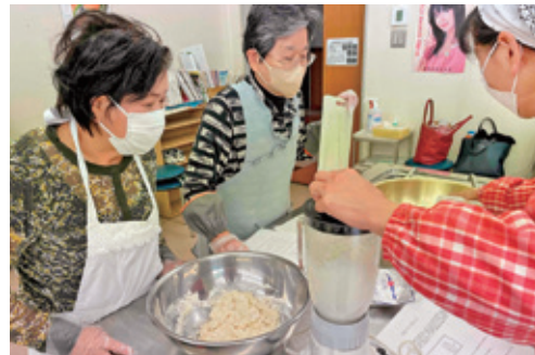
ゴキブリ駆除だんごを作る女性部員

衛生的かつ殺虫効果が約1年で経済的です。 女性部活動に参加してゴキブリ駆除だんごを作ってみませんか？