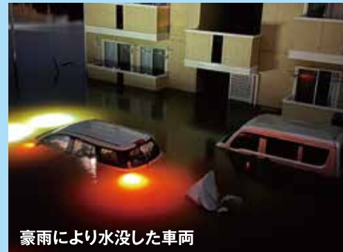
豪雨により水没した車両