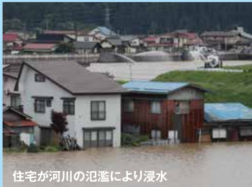
住宅が河川の氾濫により浸水