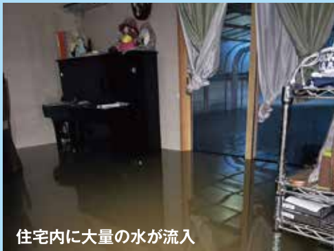
住宅内に大量の水が流入