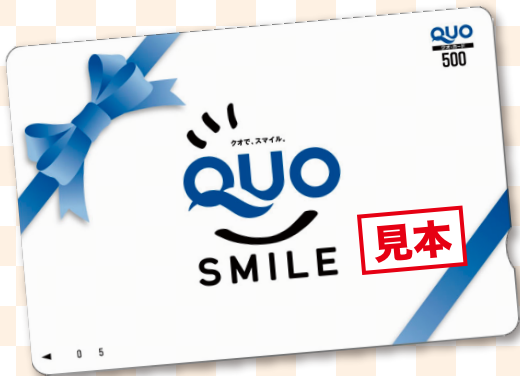
QUOカード プレゼント! (500円)