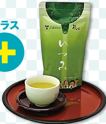
ティーバッグ茶 いつみ (5g×20袋)