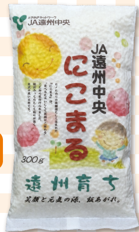
にこまる プレゼント! (精米300g)